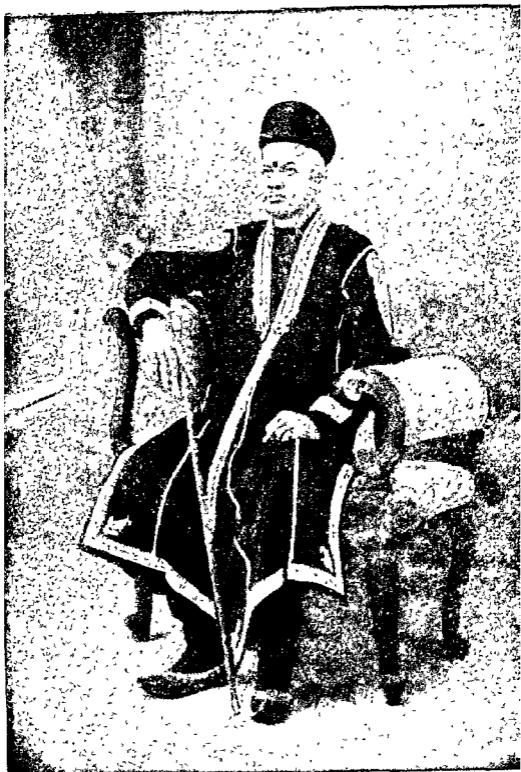
महामहोपाध्याय पं० मधुसूदन ओझा